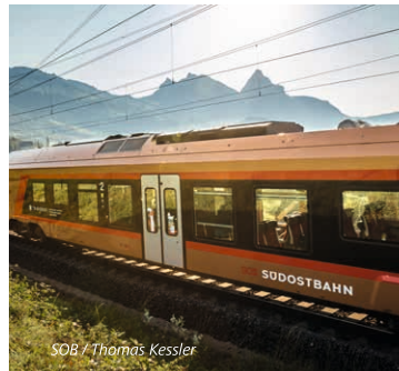
SOB / Thomas Kessler

mit Bahn, Bus und Schiff, sowie kostenlosen Eintritt in über 500 Schweizer Museen . Auch die Verkehrsbetriebe in 90 Städten und die bekannten Panoramabahnstrecken (exklusive allfälliger Reservierungszuschläge) sind in den Fahrkarten inkludiert. Außerdem gewähren die meisten Bergbahnen 50% Ermäßigung. Die Bahnen auf die Rigi, das Stanserhorn (Cabrio Seilbahn), die Brunnibahn in Engelberg sowie die Bahnen ins Bergdorf Stoos und auf die Klewenalp (Vierwaldstättersee) sind komplett im Swiss Travel Pass inkludiert.