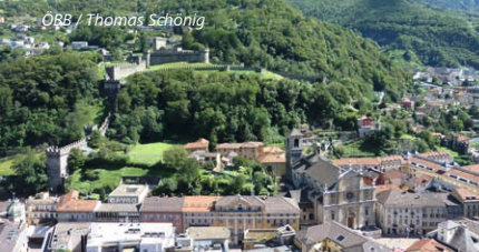
ÖBB / Thomas Schönig