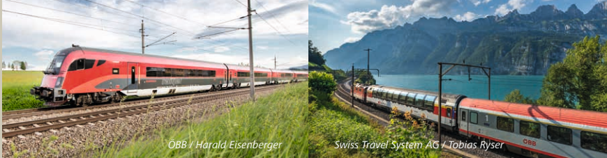
OBB / Harald Eisenberger