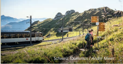
Schweiz-Tourismus / André Meier