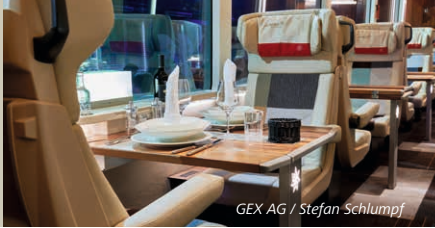
GEX AG / Stefan Schlumpf